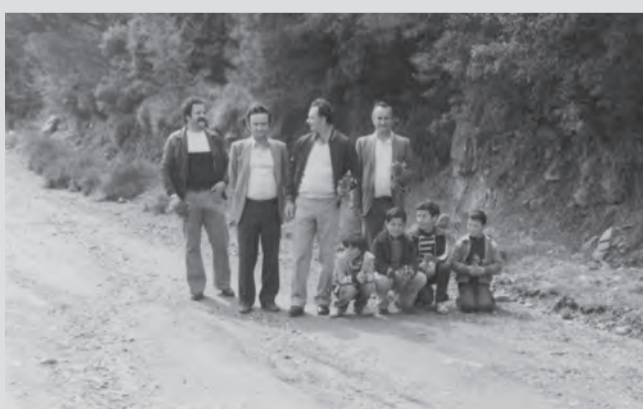
Λαγουδάκια στον επιτάφιο 1980.

Τα άρθρα σας για την εφημερίδα, καθώς και ερωτήσεις – απορίες, παρατηρήσεις, μπορείτε να τα στέλνετε στην ηλεκτρονική διεύθυνση: opatriotis@hotmail.com