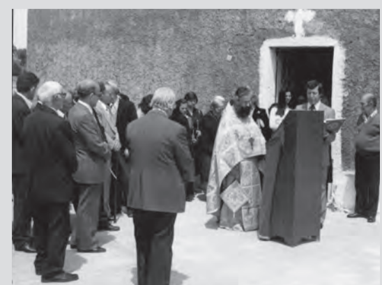
Διαπλανάση με τον σημερινό Μητροπολίτη Ξάνθης Παντελεήμονα