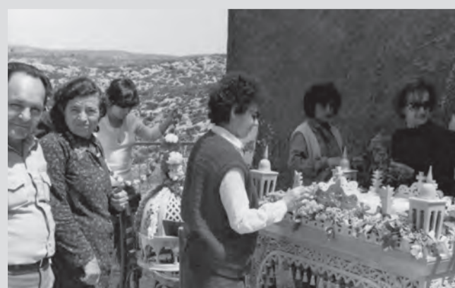
Στολισμός επιταφείου αρκετά χρόνια πριν.