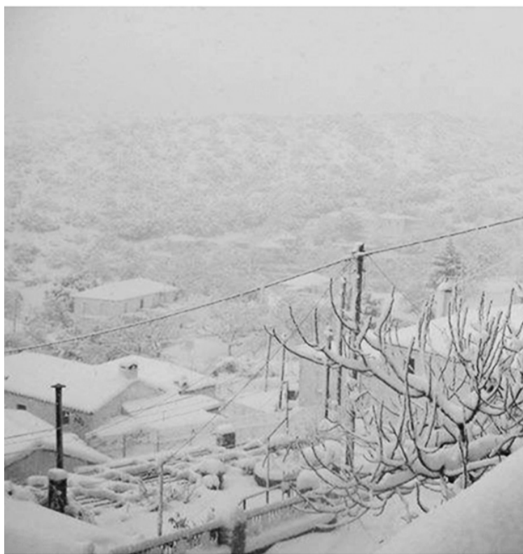
Το χωριό καλυμμένο από χιόνι, στη σιγαλιά του χειμώνα

Ε νας βαρύς ατελείωτος χειμώνας επέφερος για την πατρίδα μας, ιδιαίτερα δύσκολος για τους λιγοστούς κατοίκους του χωριού μας. Πολλές και έντονες βροχές, αλλά και χιόνια έστησαν το σκηνικό του Δεκέμβρη-Γενάρη-Φλεβάρη-Μάρτη.