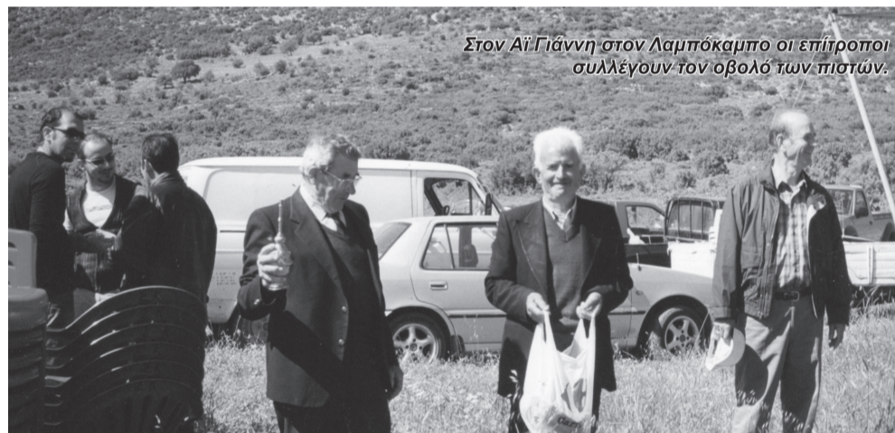
Στον Αϊ Γιάννη στον Λαμπόκαμπο οι επίτροποι συλλέγουν τον οβολό των πιστών.