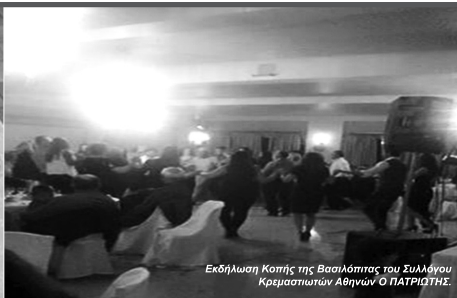
Εκδήλωση Κοπής της Βασιλόπιτας του Συλλόγου Κρεμασιωτών Αθηνών Ο ΠΑΤΡΙΩΤΗΣ.

Σ τις 7 Φεβρουαρίου 2015 πραγματοποιήθηκε στην κοσμική ταβέρνα Η ΦΩΛΙΑ (20ό χλμ. Λεωφ. Λαυρίου, Παιανία) η εκδήλωση Κοπής της Βασιλόπιτας του Συλλόγου Κρεμασιωτών Αθηνών Ο ΠΑΤΡΙΩΤΗΣ. Αρκετοί από τα μέλη του Συλλόγου