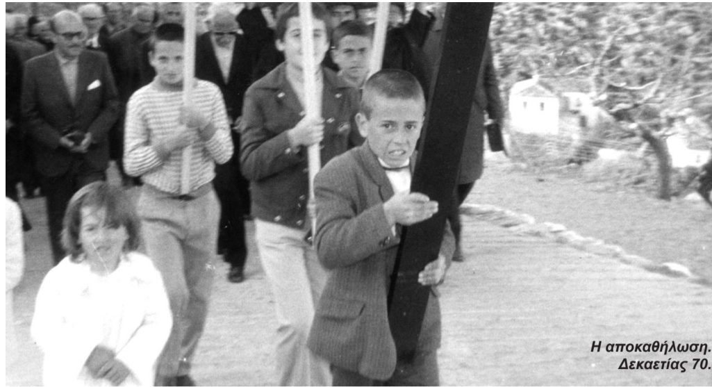
Η αποκαθάρωση. Δεκαετίας 70.

Τα παλαιότερα χρόνια, οι δρόμοι από την βρύση και τη πλατεία ως τον Αϊ Κωνσταντίνο γέμιζαν από καθαρισμένα κόκκινα αυγά, έθιμο που αργοσβήνει χρόνο με το χρόνο. Μέχρι το 1970 μετά την αγάπη γινόταν χορός στην αυλή του Νουσίου (Παναγιώτη Δρίβα) που κρατούσε μέχρι να σουρουπώσει για τα καλά.