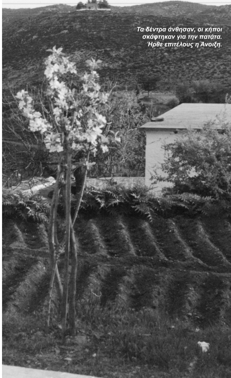
Τα δέντρα άνθησαν, οι κήποι σκάφτηκαν για την πατάτα. Ήρθε επιτέλους η Άνοιξη.

Το συνηθισμένο φαγητό: πτάτα, φασολάδα, κοφτό μακαρόνι με αχταπόδι και άφθονο κρασί, που αναπλήρωναν τις θερμίδες από