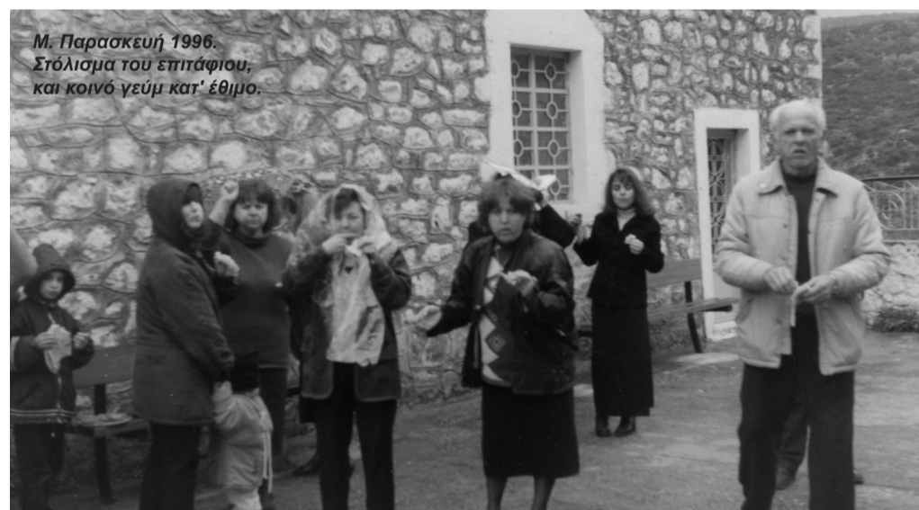
Μ. Παρασκευή 1996. Στόλισμα του επιταφίου, και κοινό γεύμα κατ' έθιμο.

Η εικόνα του Αγίου Παντελεήμονος ευρίσκεται στο ναό του Αγίου Νικολάου εκεί γίνεται η λειτουργία του Αγίου Παντελεήμονα.