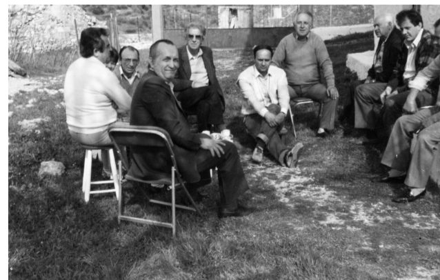
Παρέα, ανήμερα του Πάσχα 1987.

Το αυγό κατέχει κεντρική θέση στο Χριστιανικό Πάσχα. Συμβολίζει την αναγέννηση της ζωής που είναι δυνατότερη του θανάτου. Βάφεται κόκκινο, γιατί συμβολίζει τη χαρά της Ανάστασης ή το αίμα του Χριστού. Παλαιότερα, το πρώτο τουούγκρισμα γινόταν αμέσως μετά την Ανάσταση στον περίβολο της εκκλησίας. Ο συνδυασμός του σιταριού και του αυγού, δύο συμβόλων