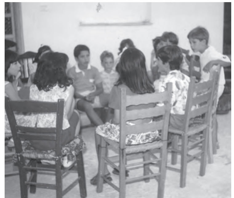
Κρεμαστιωτάκια πριν κάποια χρόνια