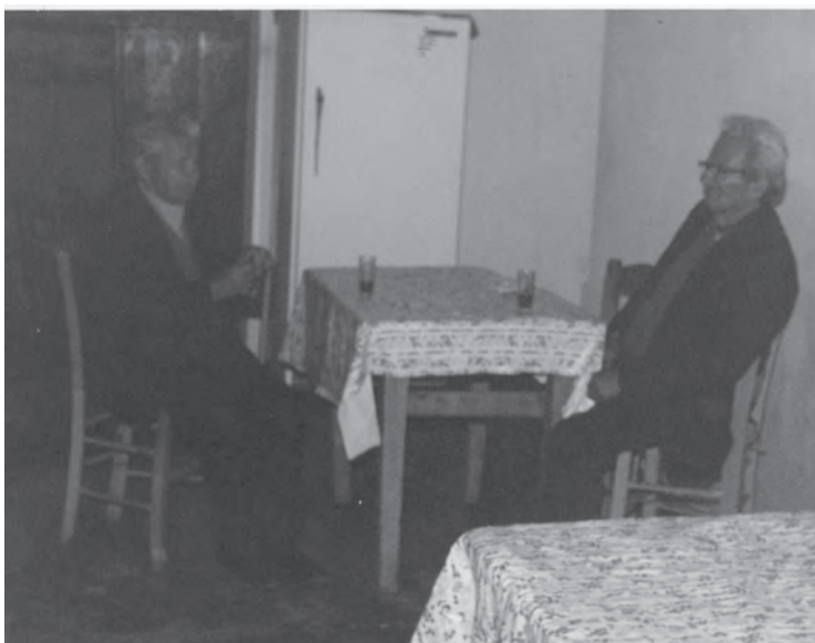
Οι κυρ Αντώνηδες του χθες λητοί - παραδοσιακοί

ΔΙΑΒΑΖΕΤΕ ΚΑΙ ΔΙΑΔΙΔΕΤΕ ΤΗΝ ΕΦΗΜΕΡΙΔΑ ΜΑΣ ΣΤΟΥΣ ΑΠΑΝΤΑΧΟΥ ΚΡΕΜΑΣΤΙΩΤΕΣ