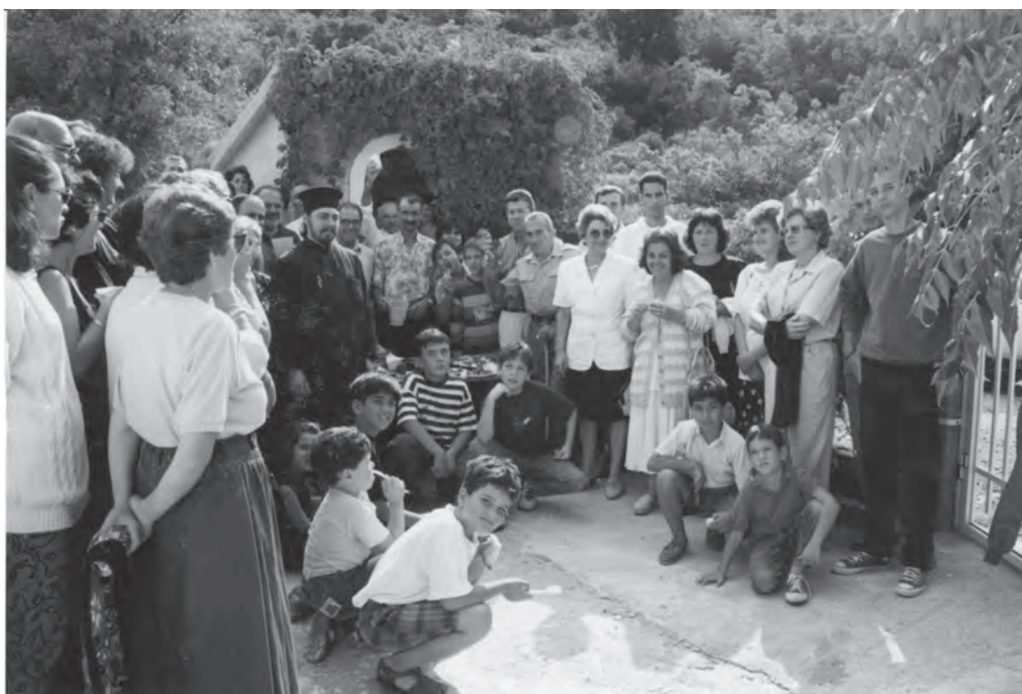
Στην Αγία Κυριακή πριν κάποια χρόνια

Ευχόμεστε και ελπίζουμε να συνεχιστεί ο θεσμός της ΑΙΜΟΔΟΣΙΑΣ και ο αριθμός των συμμετοχών να αυξάνει χρόνο με το χρόνο.