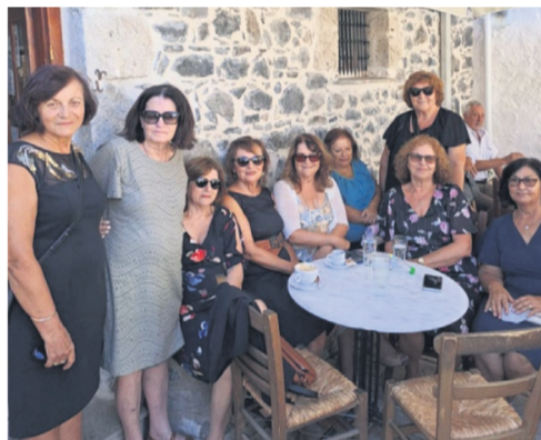
Οι μαθήτριες του Δημοτικού Σχολείου Κρεμαστής της τάξης του 1952 μαζί με φίλες τους μεγαλύτερων ή μικρότερων τάξεων αποθαμβώνουν τον καφέ τους μετά τη Θεία Λειτουργία των Εννιάμερων της Παναγίας. (Αριστερά, Αρχείο Παναγιώτας Δούνια) Τα παιδιά μας τραγουδούν και χορεύουν στην Κάτω Πλατεία μετά την παράσταση του κουκλοθέατρου (Δεξιά, Αρχείο Παναγιώτας Δούνια).

ΤΗΝ ΕΠΟΜΕΝΗ ημέρα, έλαβε χώρα η Γενική Συνέλευση του Συλλόγου Κρεμαστιωτών Αττικής Ο ΠΑΤΡΙΩΤΗΣ. Στο πλαίσιο της ανακοινώθηκε η Παραίτηση του Διοικητικού Συμβουλίου, με συνέπεια έκτακτες αρχαιρεσίες. Το Διοικητικό Συμβούλιο αποτελείται πλέον και από μέλη ηλικίας κάτω των 35 ετών.