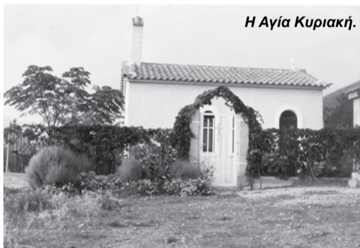
Η Αγία Κυριακή.