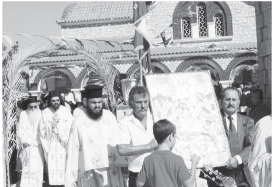
Περιφορά της εικόνας της Παναγίας τα εννιάμερα.

Η λειτουργία γίνεται στο Μητροπολιτικό ναό της Παναγίας. Τα παλαιότερα χρόνια ήταν μεγάλη γιορτή αφού εκτός του αγιασμού των σπιτιών, πήγαιναν στην εκκλησία μαντήλια με στάρι ή κριθάρι που είχαν προορισμό τη σπορά των χωραφιών. Οι ιερείς γύριζαν τα σπύτια και άγιαζαν, δεχόμενοι απ' τους πιστούς στάρι τα παλαιότερα χρόνια.