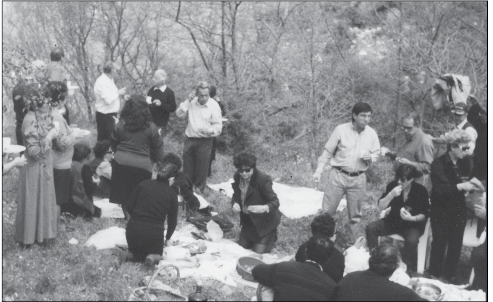
Στον Αϊ Γιώργη μετά τον εκκλησιασμό, στη βρουσούλα.

2η: Παρέα 2 ατόμων, θέλησε να εξασφαλίσει κρέας κοτόπουλο, στο χωριό. Έφτιαχνε ένα ορμαθό από κλωστή (λεπτό σπάγκο) και κόκκους σταριού (σαν μπετονιά) και τον έριχνε στις κόττες ελευθέρας βοσκής, για να τις παγιδεύσει. Ο κόκκορας που έτρεχε να φάει τους κόκκους του σταριού κατάπινε την μπετονιά και πνιγόταν. Στη συνέχεια η παρέα τον ξεπουπούλιαζε, τον μαγειρεύει και απολάμβανε τη νοστιμιά