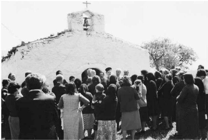
Ο Αϊ Γιάννης άλλοτε και τώρα.

ΤΟΥ ΑΓΙΟΥ ΚΩΝΣΤΑΝΤΙΝΟΥ λόγω των εκλογών δεν είχε πολύ κόσμο.